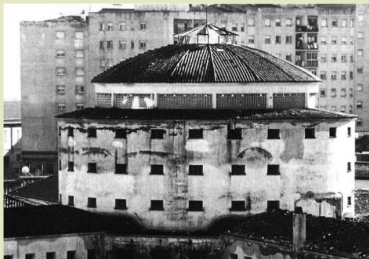
Cerrada y posteriormente derribada, la antigua Prisión Preventiva y Correccional de Badajoz pasó a convertirse en el Museo Extremeño e Iberoamericano de Arte Contemporáneo (MEIAC).

Como sistema represivo que era, el franquismo apostaba por reprimir la