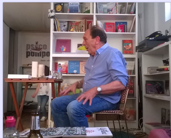
Abajo, acto celebrado en Cáceres (Librería Café Psicopompo).

En Extremadura sabemos de campo y de él vivimos toda la vida. Trajinaamos con los mejores aceites, con las sabrosas almendras y con el imprescindible ajo. Y por eso sabemos del nutritivo y refrescante ajoblanco.