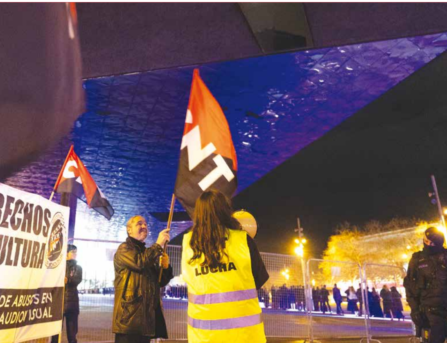
Concentración de la Sección Sindical del Sector Audiovisual en la 40 edición de los premios Goya el pasado 28 de febrero en Barcelona.