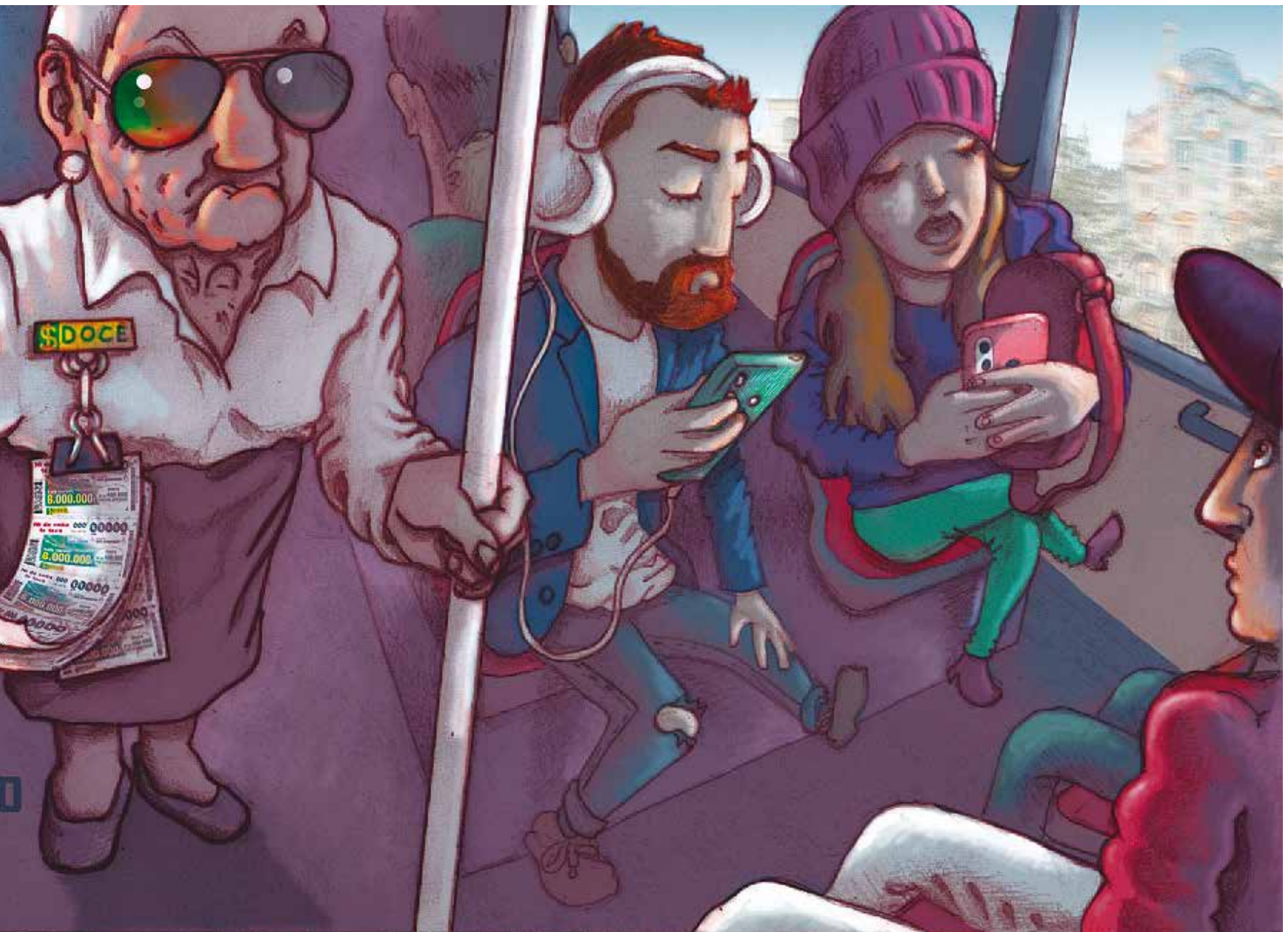
Texto e ilustración publicados originalmente en cnt 434 de 2023. / EL BELLOTERO

impiden el acceso a tratamiento, y el malestar dificulta muchísimo la mejora de nuestra situación socio económica y laboral. El acceso al empleo, así como mantenerlo en el tiempo, en el caso de las personas con problemas graves de salud mental, es complejo. Una ecuación en la que debemos incluir estigma, tabú, capitalismo y productividad.