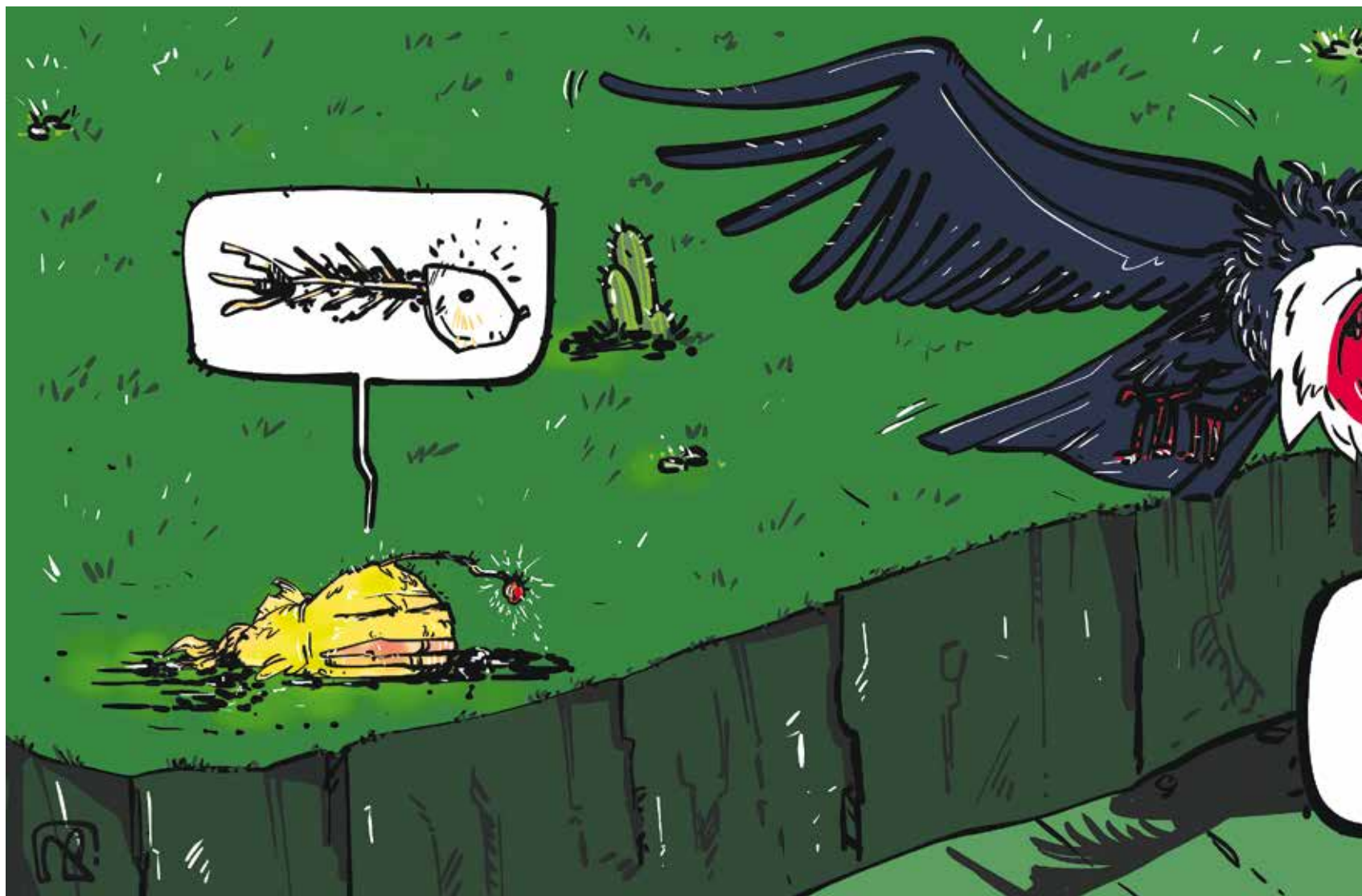
La brecha del privilegio / LA RATA GRIS