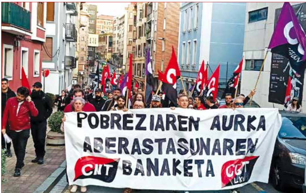
De arriba a abajo: las movilizaciones de CNT en Bilbao, Iruña y Barakaldo durante la huelga general del 17M. / CNT REGIONAL NORTE.