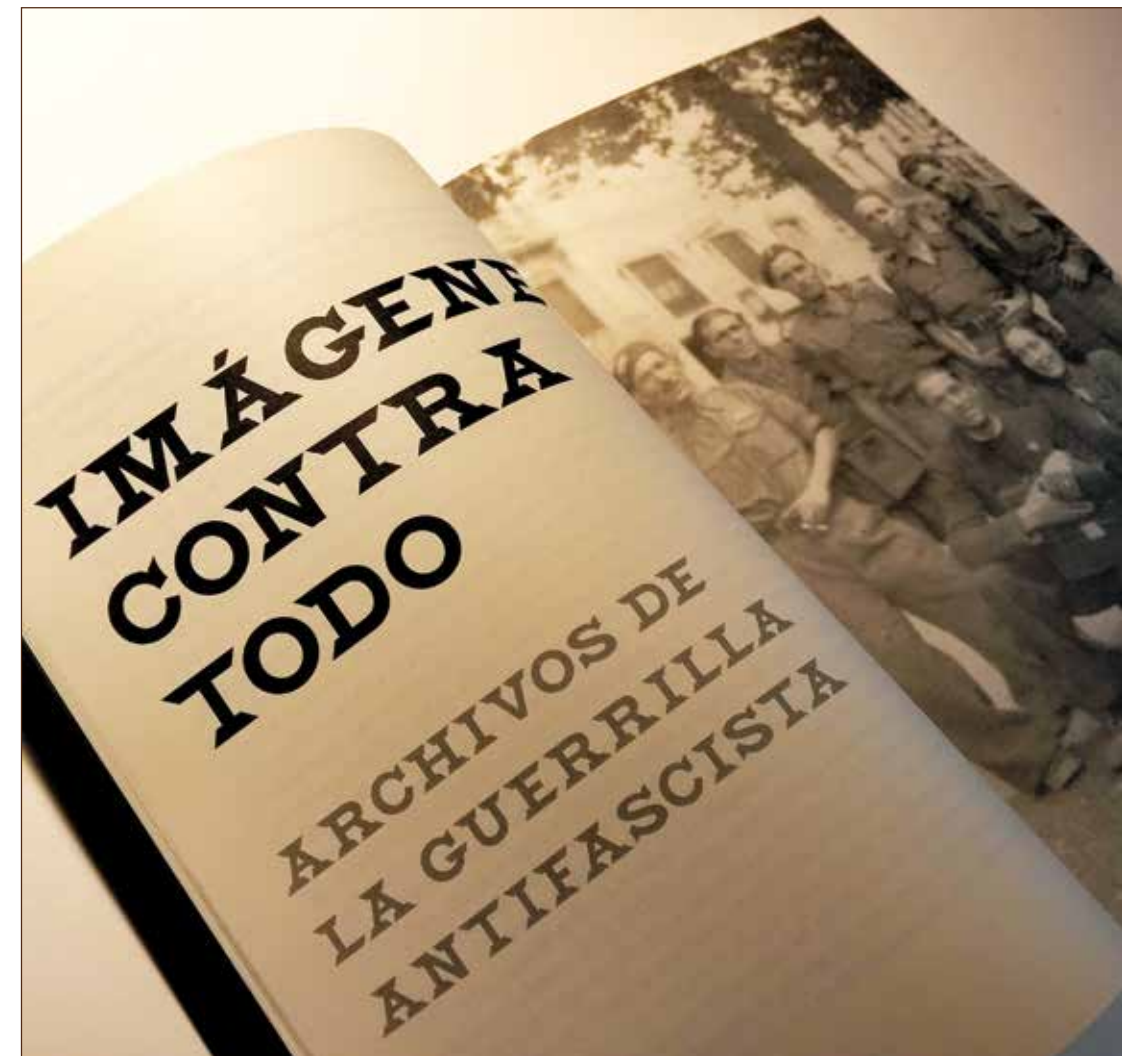
En esta y la siguiente página, fotos del libro.

Respuesta. —Las imágenes presentan lo que tratamos de pensar como un contra archivo en un ejercicio de rescatarlas de los lugares a los que se las condena con la derrota de las guerrillas antifascistas. En otras guerras en las que la lucha guerrillera fue el eje de la liberación, como las libradas por el Ejército Popular de Liberación y Destacamentos Partisanos de Yugoslavia, el Frente Nacional de Liberación en Vietnam o el Ejército Rebelde en Cuba, también se produjeron imágenes de guerrilleros heroicos. Imágenes que pasaron a engrosar tras