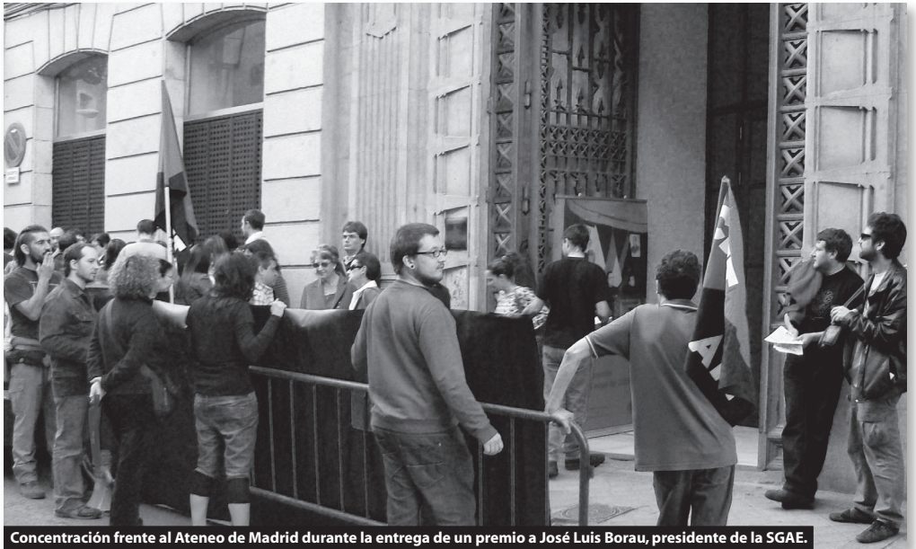
Concentración frente al Ateneo de Madrid durante la entrega de un premio a José Luis Borau, presidente de la SGAE.

tario, que ya ha padecido sus tonterías en las carnes de los y las compañeros de Alasbarriadas y ahora en las nuestras.